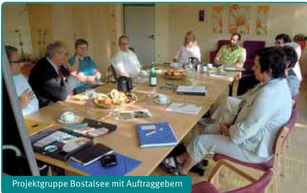
Projektgruppe Bostalsee mit Auftraggebern

Begonnen haben wir mit einer offenen Ist-Analyse innerhalb der Projektgruppen.